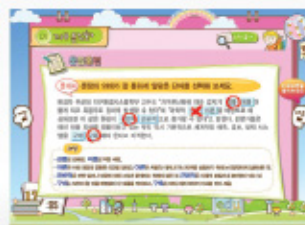
< 단어선택 O,X >