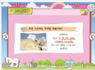
< 강의 주제 >