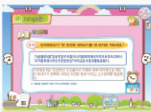
< 피어쓰기 >