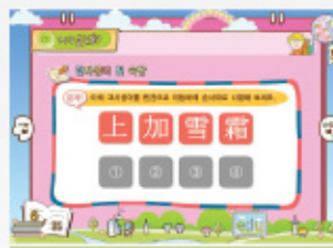
< 순서 맞추기 >