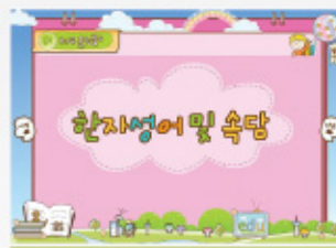
< 메뉴 화면 >