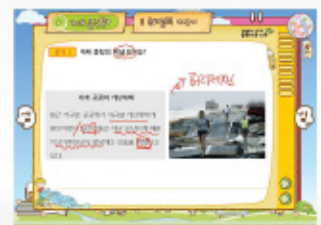
< 전자출판 강의 >