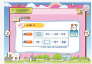
< 비슷한 말 >