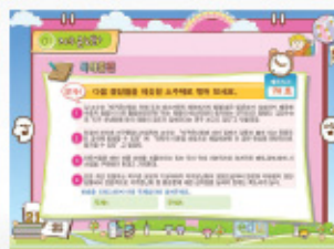
< 주제분류 >