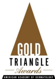
2001 골든 트라이앵글 상 수상 (미국피부과학회)