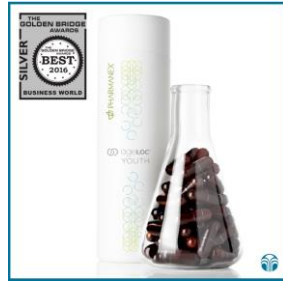
2016 골든 브릿지 어워드 소비재 및 서비스 부문 실버 선정 (에이지락 유스스판3)