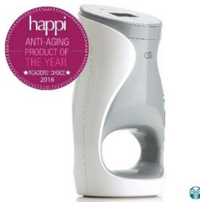
2016 매거진 Happi 선정 올해의 제품 (에이지락 미)