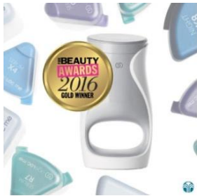
2016 퓨어 뷰티 글로벌 어워즈 베스트 프리미엄 스킨 케어 신제품 부문 골드 수상 (에이지락 미)