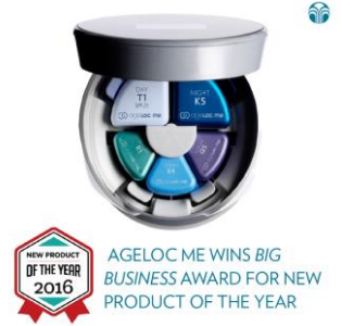
2016 빅 비즈니스 선정 올해의 신제품 (에이지락 미)