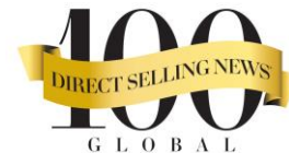
2019 다이렉트 셀링 뉴스 선정 세계 7위 직판기업