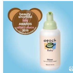
2016 뷰티 쇼트리스트 베이비 어워즈 (에포크 베이비 헤어 & 바디 워시)