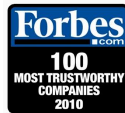
2010 포브스 선정 신뢰받는 중견기업