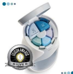
2017 에디슨 어워드 퍼스널 케어 부문 '실버 메달' 수상 (에이지락 미)