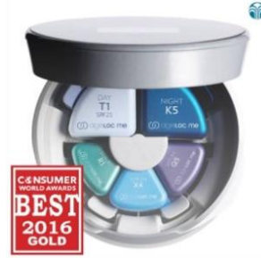
2016 컨슈머 월드 어워즈 소비재 및 서비스 혁신 부문 골드 수상