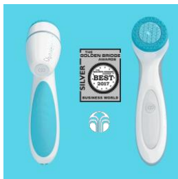
2017 골든 브릿지 어워드 소비재 및 서비스 분야 실버 워너 선정 (에이지락 루미스파)