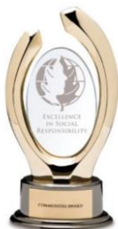
2011 커뮤니티스 어워드 교육을 통한 말라위 음달리만자 마을 건립 일조