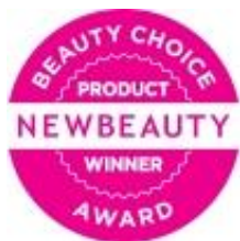
2011 뉴 뷰티 매거진 선정 뉴 뷰티 초이스 어워드 베스트 안티 링클 세럼 (에이지락 퓨처 세럼)