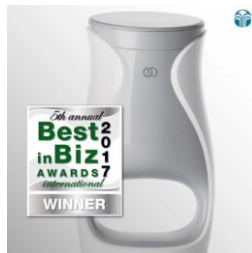
2017 비즈 인터내셔널 어워드 가장 혁신적인 올해의 제품 (에이지락 미)