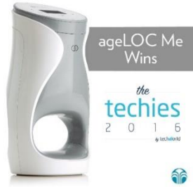
더 테키즈 2016 가장 혁신적인 제품 (에이지락 미)