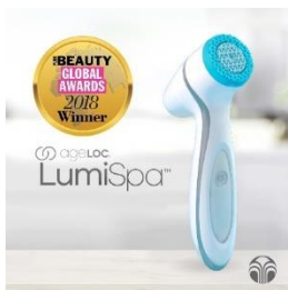
2018 퓨어 뷰티 글로벌 어워드 (에이지락 루미스파)