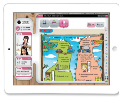
주 5회 화상 및 온라인수업