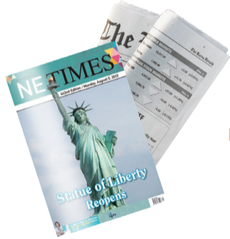
주 1회 신문 발송