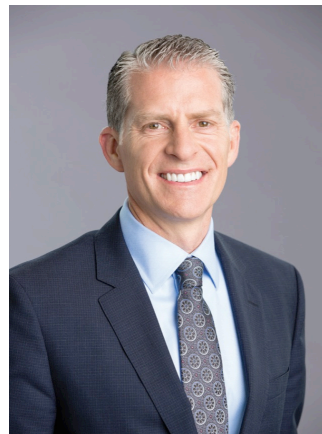
리치 우드 Ritch Wood 뉴스킨 엔터프라이즈 CEO