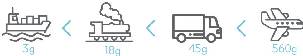
수송 수단별 온실 가스 배출량

나아가 뉴스킨은 협력 업체들이 국제 표준화 기구로부터 발부 받는 환경경영 국제 인증인 ISO 14001 인증을 받았거나 받기 위한 과정을 밟고 있는지, 혹은 화물 수송의 효율성을 높이기 위해 미국 환경 보호국(EPA)이 진행 중인 스마트웨이(SmartWay) 프로그램에 참가했는지 여부를 철저히 추적하고 있습니다.